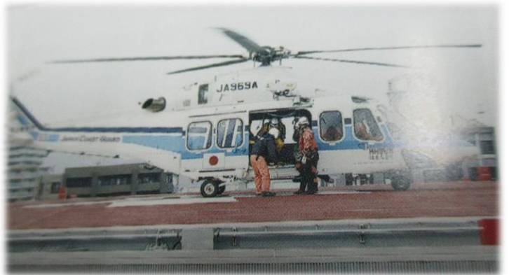
屋上のヘリポート