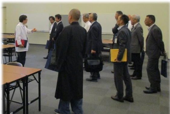
院内の説明を受ける