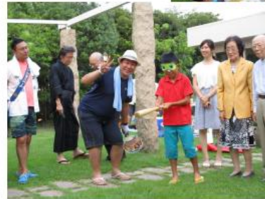
金久保家？集合！！久しぶりのお父さんとの時間楽しそうでした