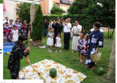
福田家集合！！がんばれ！おにーちゃん！！しっかり応援する両親と妹さん