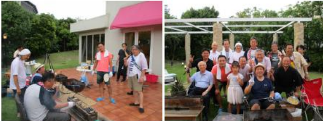
15時から準備をしている親睦委員会の面々

マリコレウェディングリゾート&レストランで18:30～開催されました。約90人の会員とその家族が集まりました。3年前の納涼家族会を経験しているのが3人だけというフレッシュな委員会メンバーで事前準備、当日準備、当日の運営しっかり楽しみました。少ない写真で伝わりにくいですが当日は天気にも恵まれ大盛況でした。