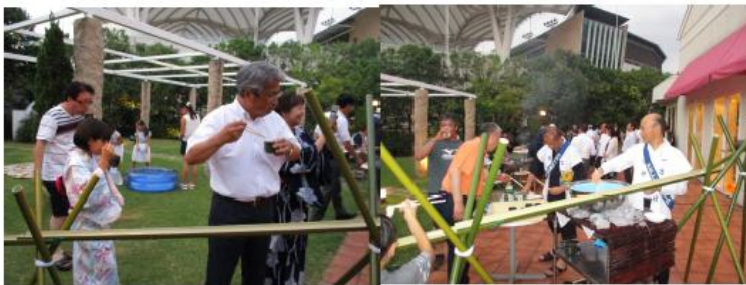
そうめん流しも大人子供に大好評！！