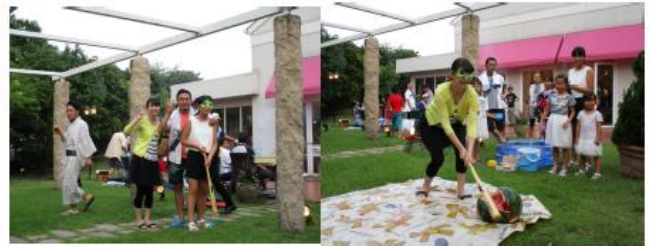
永吉家は長女さんとおかーさんの挑戦だ！！